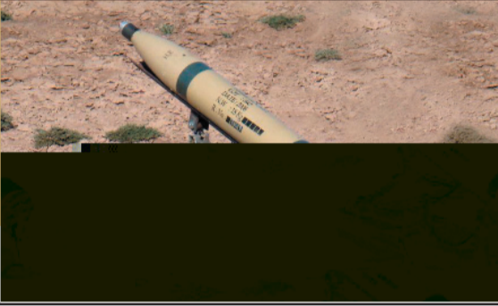
صواريخ من عيار 107 مضادة للتحصينات

تم استخدامها لأول مرة في قطاع غزة في تمام الساعة ١٢:٠٠ من ظهر يوم الثلاثاء ١٦ محرم ١٤٣٠ هـ الموافق ٢٠٠٩/١١/١٣م حيث أطلقت تجاه منزل تحصن به قوة صهيونية خاصة بشرق خان يونس.