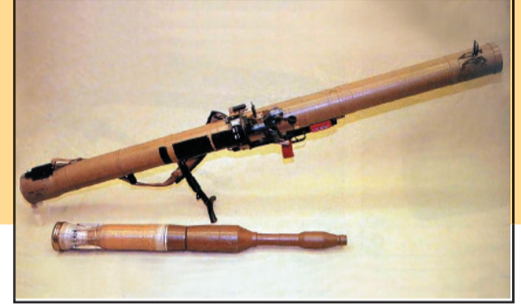
قذائف الـ RPG-29 المضادة للدروع

تم استخدامها لأول مرة في قطاع غزة في تمام الساعة ١١:٠٠ من صباح يوم الأحد ٠٨ محرم ١٤٣٠ هـ الموافق ٢٠٠٩/١١/٠٤م حيث أطلقت تجاه دبابة صهيونية متوغلة بشرق حي التفاح مما أدى إلى تدميرها بالكامل.